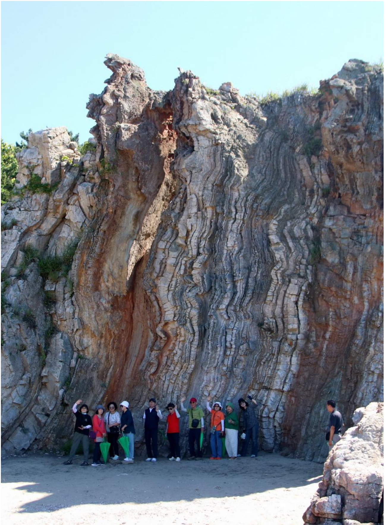
*능여해변 나이트 바위