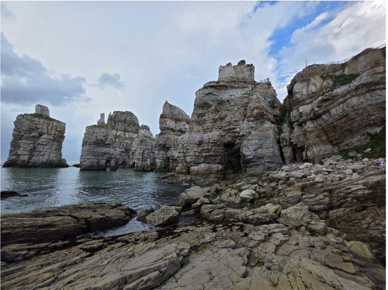
*용가포 등다 해변

며칠 전부터 일기예보에 귀를 기울였다. 바닷가는 태풍과 국지성 호우로 날을 잡아놓고도 못 가는 것이 흔한 일이며, 섬에서 하루 이틀 발이 묶이는 일도 종종 일어난다. 아니나 다를까 멀쩡하던 날이 갑자기 캄캄해지면서 달구비가 쏟아진다. 너울이 심해 여기저기서 배멀미를 호소하는 승객이 늘어났다. 한동안 불안해 눈을 감고 있었는데, 언제 그랬냐는 듯 날이 개었다. 갑판에 올라 끝없이 펼쳐진 바다를 바라보고 싶었다. 그러나 여객선이 군사 작전구역을 지나기 때문에 선상에서 사진 촬영이 엄격히 제한되며, 서해는 파도가 심해 안전 예방 차원에서 갑판 개방을 금한다고 하였다. 맨 앞자리에 앉은 나는 창가에 앉은 사람을 부러워하며 검푸른 바다를 결눈질했다.