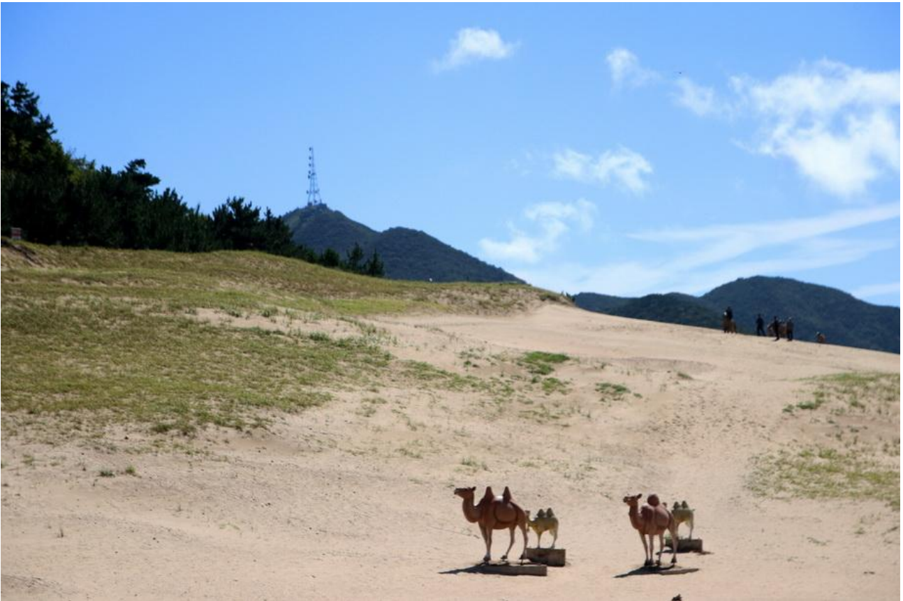
*옥중동 해안 사구

콩돌해안은 사곶해변 멀지 않은 곳이다. 모래 해변 가까운 곳에 전혀 다른 콩돌해안이 자리한다는 것은 자연의 신비로움이다. 지질공원 해설사는 콩돌해안 설명을 하며 맨발로 걸어 보라고 한다. 운동화를 벗었다. 돌의 크기는 조금씩 달랐지만 하나같이 동그랗다. 얼마나 오랜 세월 구르고 부대끼며 이리도 동글동글 콩돌이 되었을까. 돌 사이에 파묻힌 발은 자유롭게 움직일 수 없고, 발바닥이 간지러워 해변에서는 웃음꽃이 핀다. 해변의 규암이 풍화와 침식 작용으로 부서진 후, 파도와 태풍이 그 조각들을 굴리고 굴려서 동글게 변했다는 콩돌해변은 천연기념물 제392호로 지정되었다. 모난 돌은 하나도 없다. 사람들은 모난 돌이 없어 다치지 않을 거라는 믿음으로 해변을 자유롭게 걷는다. 해변의 오색 콩돌은 그냥 돌이 아니라, 오랜 세월 파도에 구르고 깎이며 인내로 빚어진 자연의 보석이다. 해변에서 즐겁게 노는 사이, 지질 해설사가 일행의 이름을 수놓았다. 콩돌로 수놓은 박은화, 황영자 이름이 너무 예뻐 '내 이름도 써 줘요' 생떼를 쓰며 한바탕 웃었다.