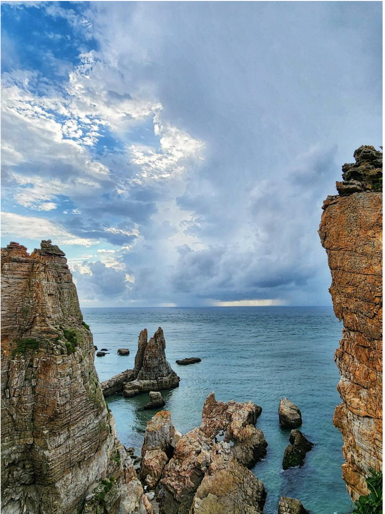
*용기포 등대 해변