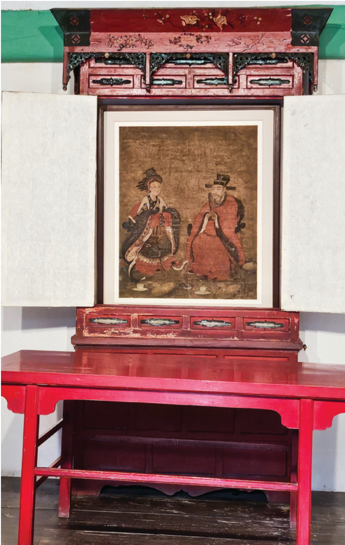
*공민왕과 노국공주 영정