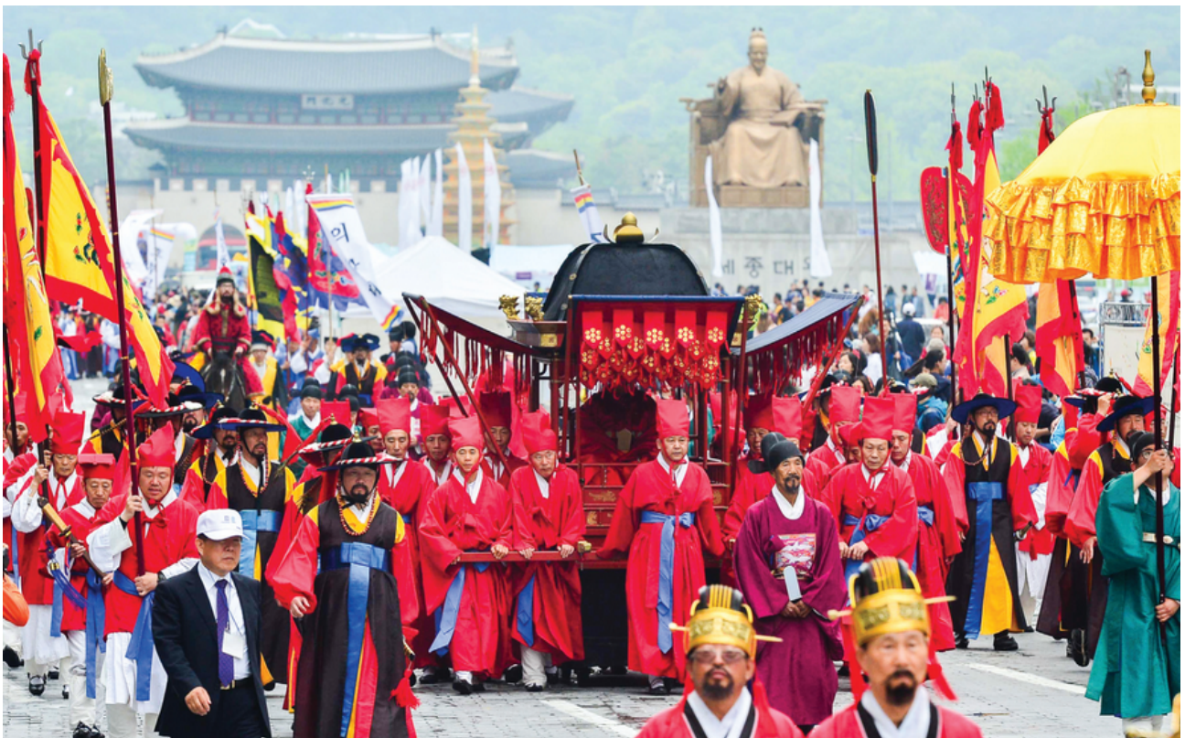
*종묘대제 어가행렬

망묘루 뒤편에 공민왕 신당이 있는 것은 뜻밖이다. 조선 왕실 사당인 종묘에 고려 제31대 공민왕과 노국공주의 영정을 모신 것은 무슨 이유일까. 역성혁명을 한 태조 이성계가 고려 왕조에 대한 정치적 배려였다고도 하고, 종묘 창건 때 공민왕 영정이 바람에 마당으로 떨어져 조정에서 회의 끝에 그 영정을 봉안하기로 하였다는 이야기가 전한다.